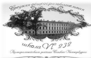
Рисунок 1 – Школа №232

В тезисах формулируется рассматриваемая проблема, цель работы, её задачи. Кратко аргументируется актуальность исследования, дается пример метода исследования и основные результаты. Тезисы представляют собой текст, состоящий из повествовательных предложений. В изложении следует избегать использования местоимения «я». Например, вместо «Я рассмотрел следующие структуры» предпочтительно написать «Были рассмотрены следующие структуры» и т.д.